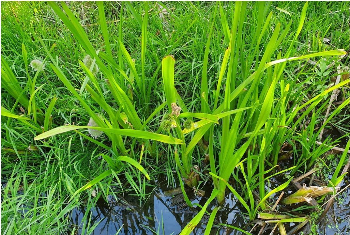
obr. zevar vzpřímený ( Sparganium erectum ) a vrbovka chlupatá ( Epilobium hirsutum )