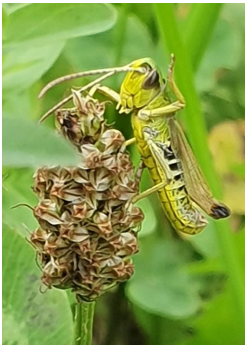
obr. sameček saranče obecné ( Pseudochorthippus parallelus )