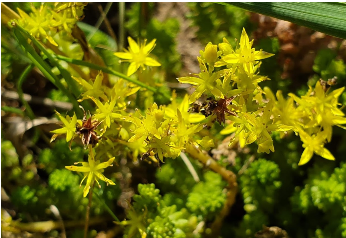
obr.: rozchodník ostrý ( Sedum acre ) a rozchodník španělský ( Sedum hispanicum )