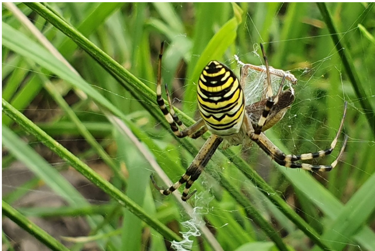
obr. křižák pruhovaný ( Argiope bruennichi )